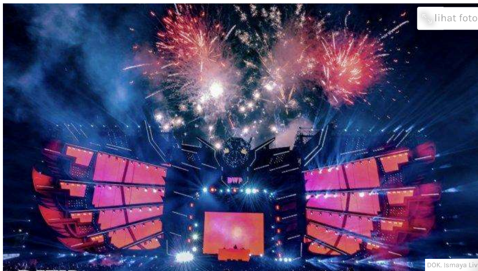
Panggung Garuda Land di Jakarta Warehouse Project (DWP) 2022

TRIBUNNEWS.COM, JAKARTA - Seorang warga negara Malaysia mengaku diperas Rp200 ribu oleh oknum polisi saat menonton konser Jakarta Warehouse Project (DWP) 2024 di JIExpo Kemayoran, Jakarta Pusat, 13-15 Desember 2024.